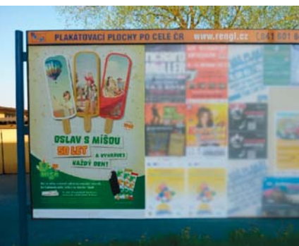
Unilever ČR, produkt