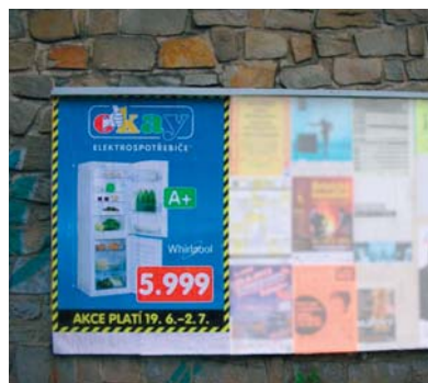
Okay Elektrospotřebiče, produkt