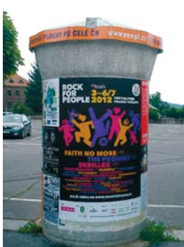
Rock For People, kulturní akce