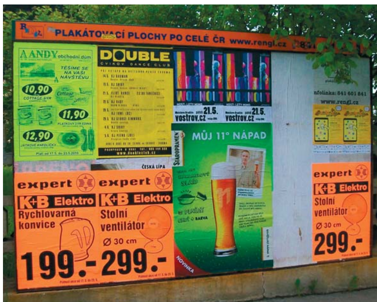
Ukázka kampaně realizované pro klienta Staropramen v roce 2010