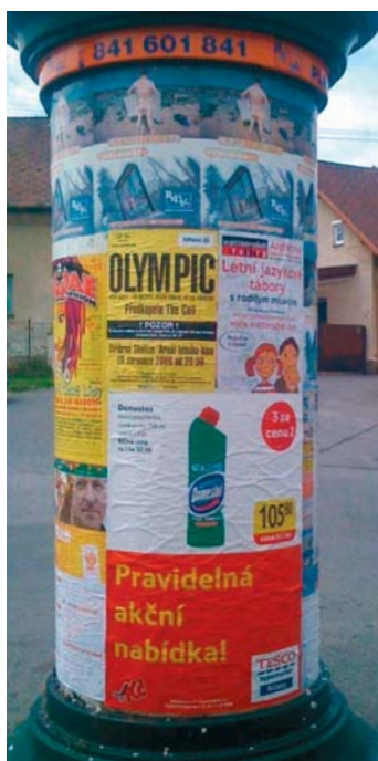
Ukázka kampaně realizované pro klienta TESCO v roce 2011